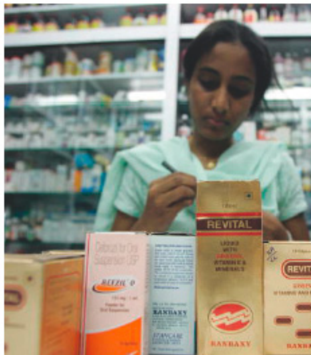
Apothek in Mumbai: Indische Hersteller von Nachahmerprodukten stellen mit knapp 22 Prozent die größte Länderposition im Pictet Generics